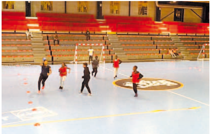
L'engagement par le gardien de but pour rendre le jeu dynamique et attractif

choix plus fréquents (course, passe ou dribble), le travail de certains postes (demi-centre et ailier); l'orientation des buts à l'oblique accroît le rôle des ailiers, etc.